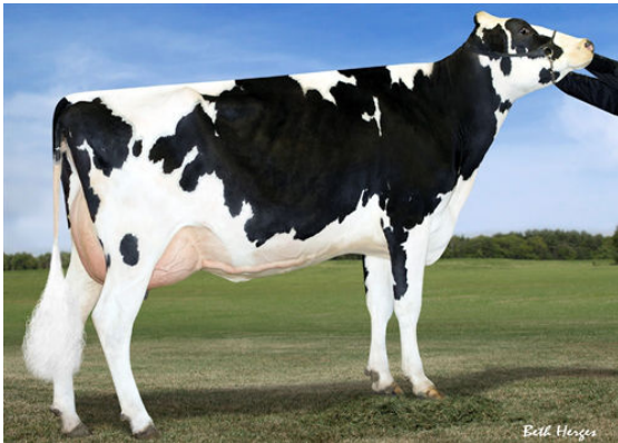
B-ENTERPRISE SUPER GIGI GRANDDAM